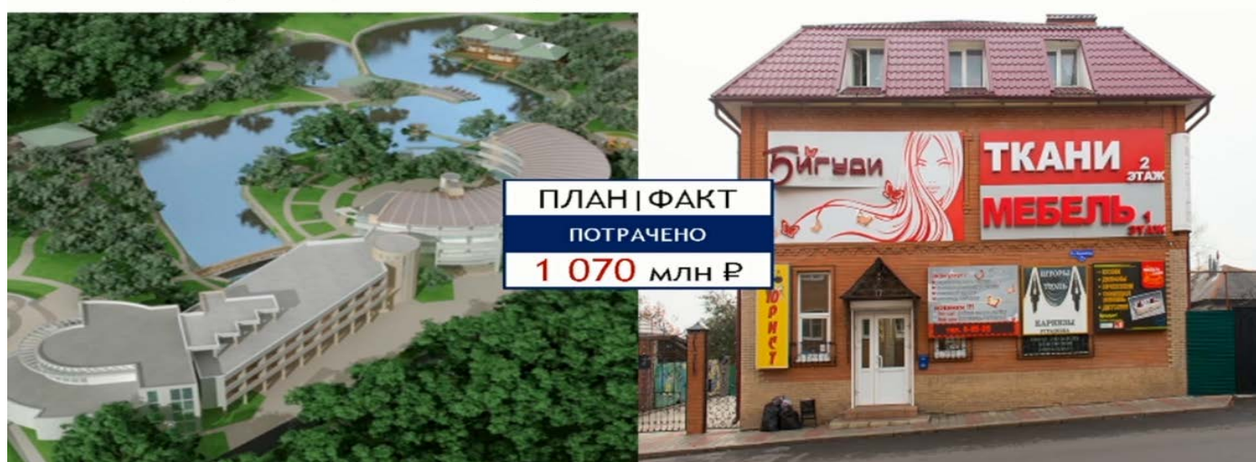
ТРК «Елец» (Липецкая область)

5. Хабаровский край. В программу туристической зоны «Остров большой Уссурийский-Шантары» включили современный гостиничный комплекс «Воронеж», который... давно работал, а также отличный современный загородный гостиничный комплекс «Заимка», который уже