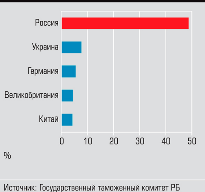
Доля в общем товарообороте Республики Беларусь за 2017 год, топ-5 стран График 2

При этом Союзного государства Белоруссии и России как субъекта международного права не существует. У СГ нет единой столицы, исполнительной, законодательной и судебной властей, единого гражданства, силовых ведомств, признанных границ, флага, герба. Существующие институты СГ работают с ограниченным набором функций. К примеру, Высший государственный совет состоит из двух президентов и двух премьер-министров. В момент его создания планировалась ротация главы совета, но с момента создания совет возглавляет Александр Лукашенко, и отнять этот пост у него не представляется возможным. До настоящего времени ВГС был занят в основном согласованием очередных дотаций, преференций и субсидий белорусской экономике.