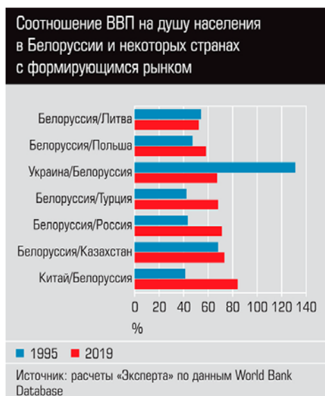
Соотношение ВВП на душу населения в Беларуси и некоторых странах с формирующимся рынком

Четверть века назад наша передняя линия обороны на западе проходила через Восточную Германию, Чехословакию, Югославию, Болгарию (см. карту). Расстояние до советской границы составляло 500–800 км (см. «Исключение исключительности», «Эксперт» № 35 за 2014 год). После развала Советского Союза и расползания НАТО на восток глубина театра военных действий была потеряна. В дальнейшем дуга безопасности проходила по линии Калининградская область – Беларусь – Приднестровье – Севастополь. В 2014 году последовало болезненное геополитическое поражение: мы потеряли Украину, но, к счастью, сохранили Крым. Появилась брешь, которую уже заполняют западные силовики. Потеря Беларуси расширит пробоину. Что это означает на практике?