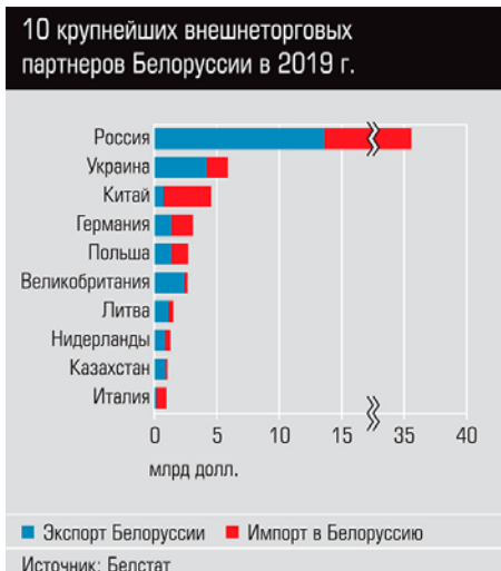
10 крупнейших внешнеторговых партнеров Беларуси в 2019 г.

Александр Лукашенко справился с первой волной протестного цунами и сильно упрочил свои шансы остаться на какое-то время у руля белорусского государства. Вряд ли надолго: легитимность президент утратил, проведя очевидно грязные выборы и получив невероятно массовую реакцию по всей стране. Однако возникший вакуум власти никто не использовал. У митингующих на улице не появилось политической и экономической программы, сильных лидеров, а главное, идей, что предложить стране взамен Батьки. Несколько пошатнувшаяся система вновь взяла равнение на Лукашенко . Он переназначил правительство, расставив «старичков» по своим же местам, наградил силовиков за верную службу и пока не заикается о новой конституции или переговорах с оппозицией. Вновь начались аресты на улицах и точечная работа спецслужб. Активизировались и сторонники Лукашенко с провластными демонстрациями по всей стране. Первый раунд окончился едва ли не в пользу президента: последняя надежда оппозиции – на митинги 22–23 августа. Но радикализмом вежливый белорусский бунт не отличался ни минуты. А с чистыми руками, воздушными шариками и старыми песнями власть не захватывают.