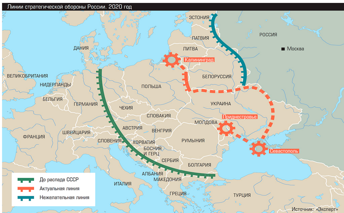
Линии стратегической обороны России. 2020 год