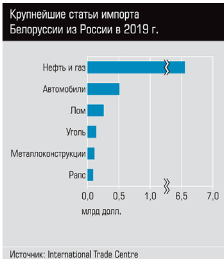
Крупнейшие статьи импорта Белоруссии из России в 2019 г.

В том же духе высказалась и Литва. «Беларусь должна самостоятельно обрести свой путь, это должно произойти посредством диалога внутри страны, вмешательства извне быть не должно», – заявила Ангела Меркель . «Евросоюз не хотел бы, чтобы в Беларуси повторился украинский сценарий», – заметил Эммануэль Макрон . Консолидированного политического давления не получилось, поэтому в ход вступили гибридные методы того самого вмешательства извне.