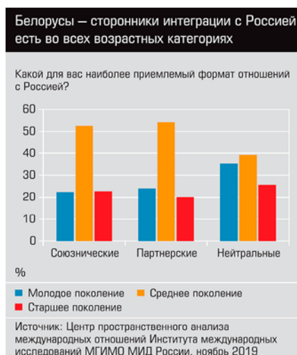
Белорусы – сторонники интеграции с Россией есть во всех возрастных категориях

Белорусские протесты уже успели сравнить со всеми революциями последних десятилетий – от позднесоветских восстаний в странах Варшавского договора до Египта, Болотной и Майдана. Однако заповедник социалистического госкапитализма, скорее, идет в ногу с современными революционными явлениями. Технологически действия оппозиционных масс вобрали опыт гонконгских восстаний: сетевой безлидерской координации через мессенджеры и анонимные телеграм-каналы с поддержкой из