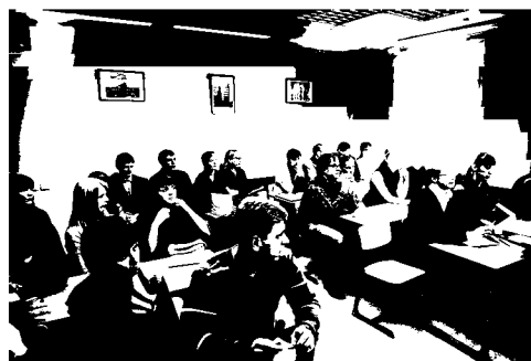
Участники «Часа аспиранта»

«Час аспиранта» включает два раздела: «Новости недели» и «Новости аспирантуры». На встречах обсуждаются актуальные события в мире, стране и регионе; аспиранты знакомятся с информацией о конкурсах и конференциях, решают актуальные организационные вопросы, обсуждают статьи, прочитанные в отечественных и зарубежных журналах. В дальнейшие планы входит организация встреч с авторитетными учеными в области экономики и управления.