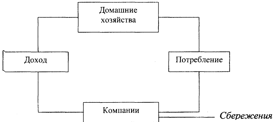
Рис.3. Включение инвестиций (капиталовложений) в кругооборот дохода

С другой стороны, средства домашних хозяйств, превратившиеся в сбережения, порождают собой инвестиции, что представляет собой вливание средств в кругооборот доходов. При этом инвестировать средства могут не только домашние хозяйства, но и предприятия (рис.3).