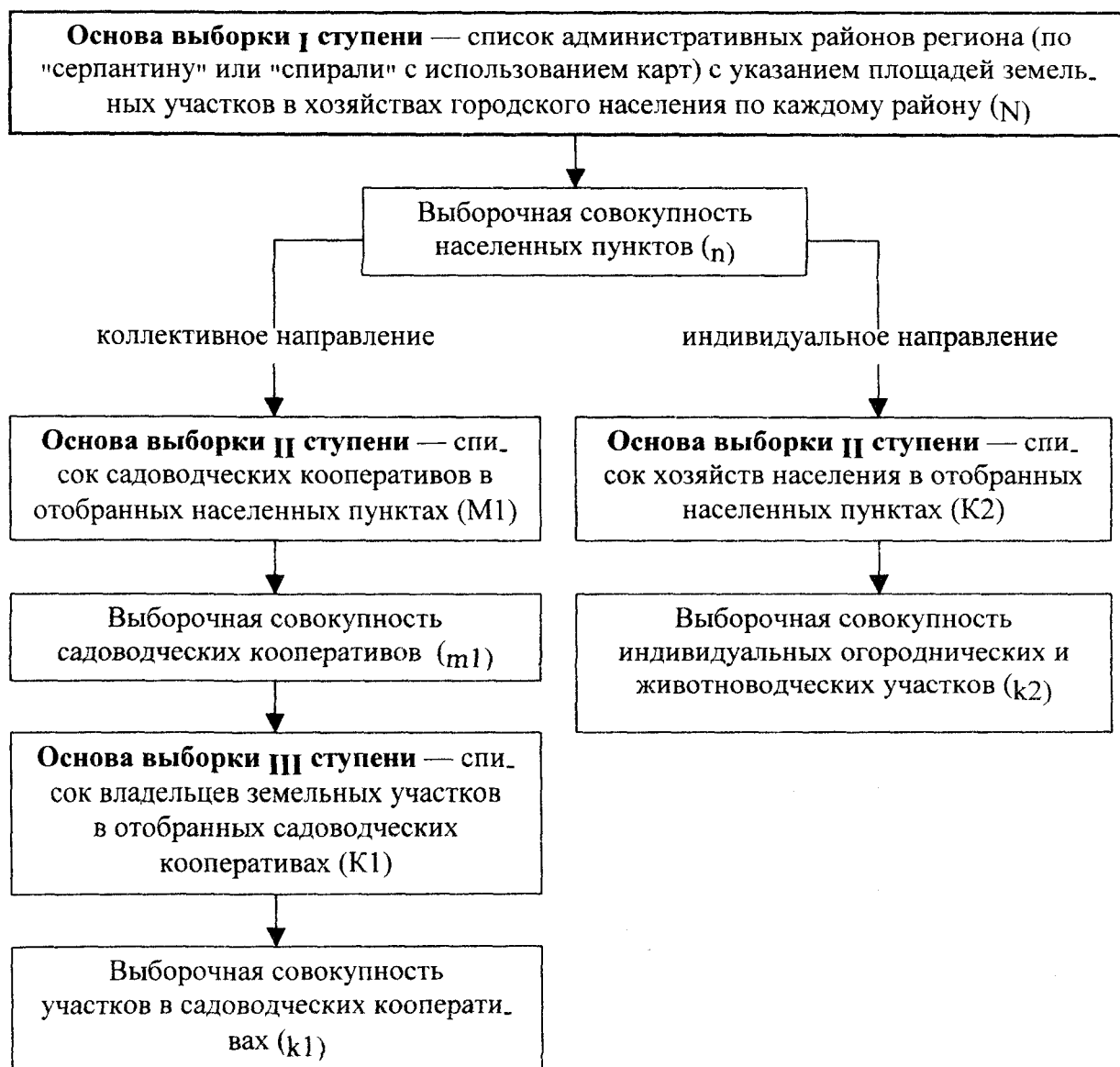
Рис. 2. Схема трехступенчатой территориальной случайной выборки

Отбор участков во втором, индивидуальном, направлении проводится в один этап: на основании списков плательщиков земельного налога методом случайного отбора выявляются обследуемые хозяйства.