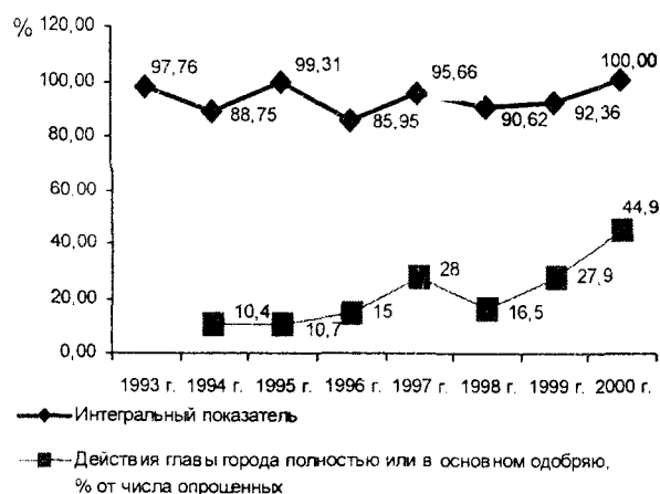
Рис. 3. Динамика интегрального показателя и позитивных оценок вологжанами деятельности главы г. Вологды

Таким образом, можно сделать вывод о том, что предлагаемый интегральный показатель в достаточной степени характеризует изменения, происходящие в социально-экономическом развитии города, и может быть рекомендован в качестве оценки эффективности деятельности администрации города