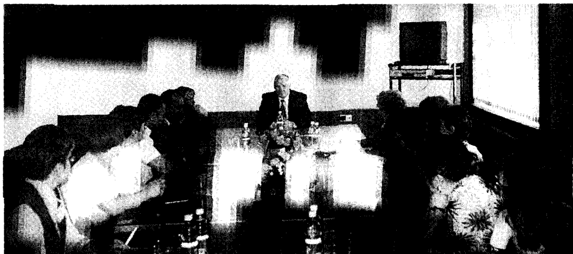
Встреча с участниками конференции в ВНКЦ ЦЭМИ РАН (27 июня 2002 г.)

Необходимо добиться того, чтобы финансовая политика государства строилась в соответствии с системой общественных предпочтений, обеспечивая переход на справедливые принципы формирования собственности и распределения национального дохода, а также развитие наукоемкого производства и высокотехнологичных отраслей. В политической сфере необходим механизм действенного контроля общества за эффективностью и безопасностью действий государственных органов, за соблюдением основ конституционного строя в части статьи 7 Конституции РФ (на федеральном, региональном и муници-