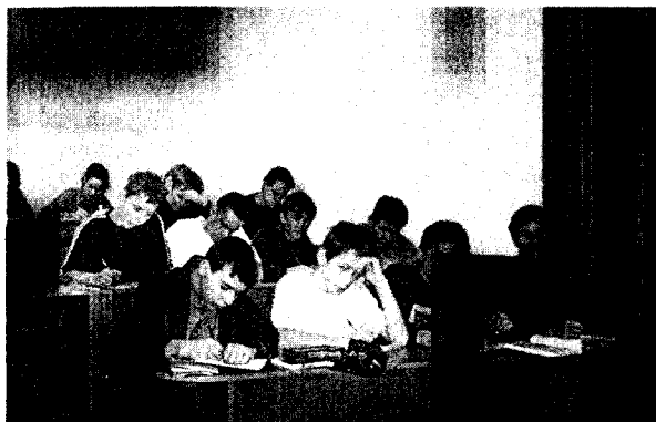
Процесс пошел... (В лекционном зале ВНКЦ)

Начиная с IV четверти, когда учащиеся овладеют основными теоретическими знаниями по экономике, планируется включить в занятия метод профессиональных проб «Научная деятельность».