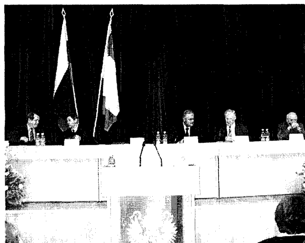
В президиуме конференции

ных инструментов реализации социально-экономических преобразований в современной России, а также вопросы построения взаимоотношений Федерации, регионов и муниципальных образований.