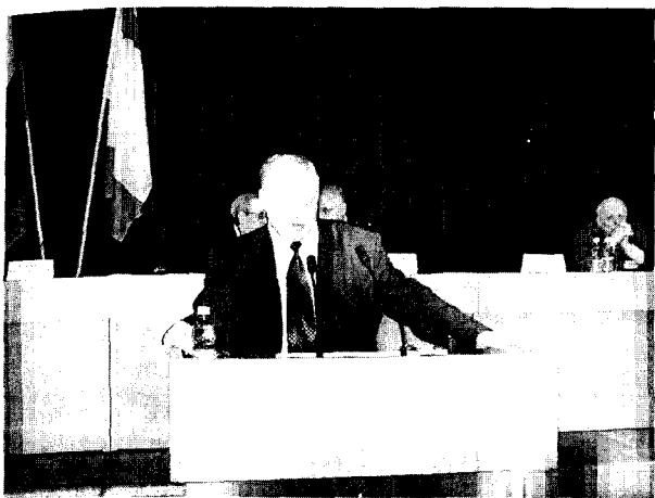
Выступает В.А. Ильин

С основным докладом от Правительства области выступил первый заместитель Губернатора Н.В. Костыгов, рассказавший о главных результатах, стратегических направлениях и перспективах социально-экономического развития региона.