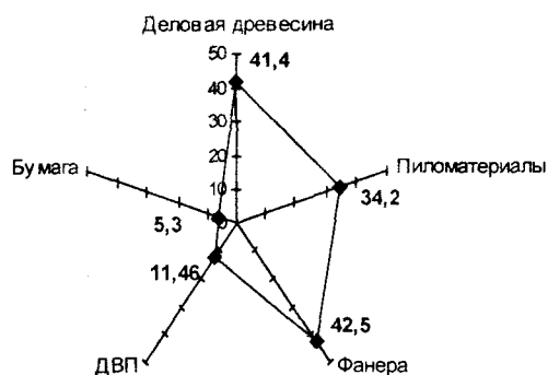
Рис. 2. Доля экспорта в объеме производства отдельных видов продукции ЛПК Вологодской области в 2002 г. (в %).

в объемах, опережающих спрос на внутреннем рынке. В результате этого при сокращении экспорта хвойных круглых лесоматериалов на 16% (к уровню 1999 г.) доля экспорта