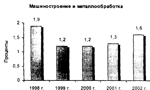
Рис. 1. Динамика доли машиностроения и металлообработки в общем объеме промышленного производства в Республике Коми.

Доля отрасли «машиностроение и металлообработка» в сравнении с 1990 г. уменьшилась в пять раз и составила в 2002 г. всего 1,6% в общем выпуске промышленной продукции в республике (рис. 1).