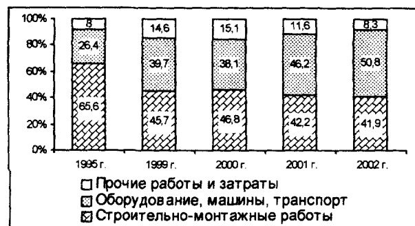
Рис. 1. Технологическая структура инвестиций в основной капитал по Вологодской области (в % к итогу).

Для оценки структуры инвестиций немаловажное значение имеет их технологическая структура (рис. 1). Представленные данные говорят о том, что темпы роста затрат на оборудование, машины, транспорт, инструмент являются опережающими по сравнению с затратами на выполнение строительно-монтажных работ. Эта позитивная тенденция требует не только сохранения, но и дальнейшего развития.