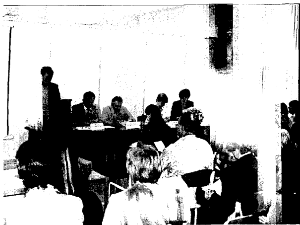
На одном из секционных заседаний