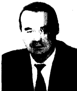
Грачев Виктор Васильевич – д.э.н., начальник департамента промышленности, предпринимательства и лесного комплекса Правительства Вологодской области.

Степень осознания важности инновационного развития на всех уровнях (от Правительства РФ до организаций и предпринимателей) в последние годы неуклонно растет. Переход к инновационному развитию страны опреде-