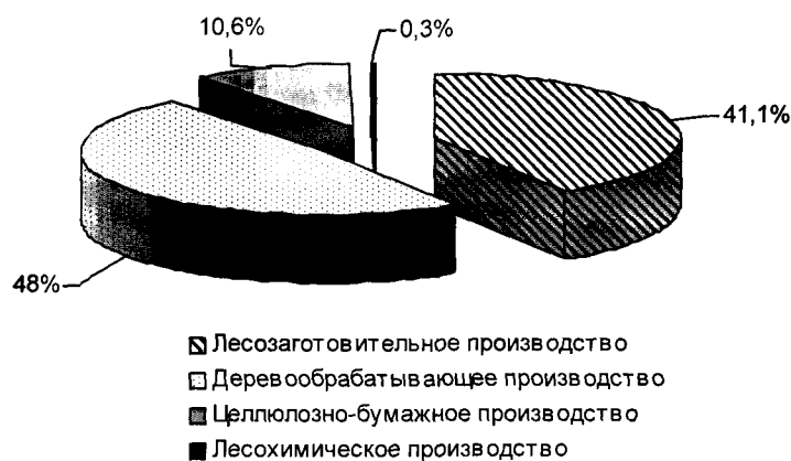
Рис. 1. Структура лесопромышленного комплекса Вологодской области в 2002 г.

готовительная, деревообрабатывающая, целлюлозно-бумажная и лесохимическая), удельный вес лесозаготовительного производства довольно значителен и составляет 41,1% (рис. 1), что свидетельствует о недостаточном уровне лесопереработки.