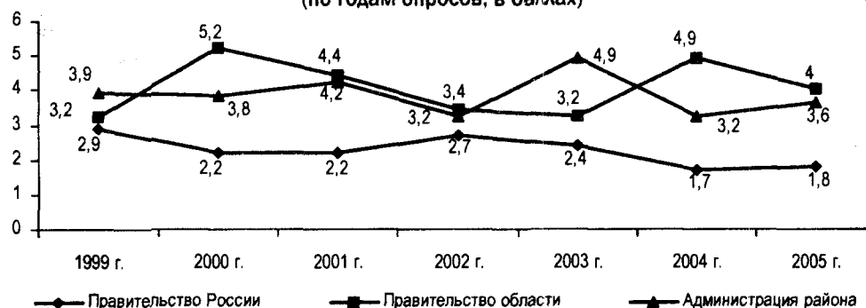
Рис. 2. Оценка результативности деятельности органов власти и управления (по годам опросов; в баллах)

В качестве первоочередных мер, которые необходимо принять сельхозпредприятиям до вступления России в ВТО, респондентами названы: техническое переоснащение производства (88,9%), внедрение инновационных технологий (85,2%), снижение издержек производства (70,4%), организация производства продукции по международным стандартам качества (51,9%).