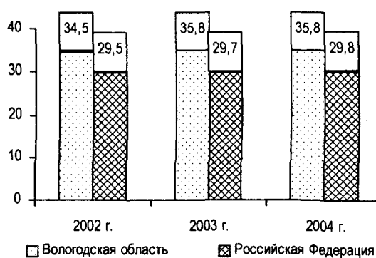
Рис. 1. Всего родившихся у женщин вне зарегистрированного брака (% от общего числа родившихся)