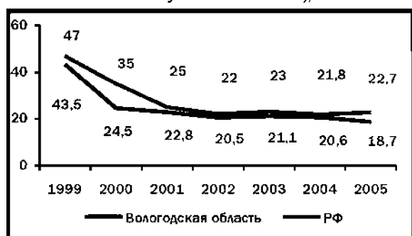
Рис. 3. Доля населения с низким уровнем запаса терпения («терпеть наше бедственное положение уже невозможно»), в %