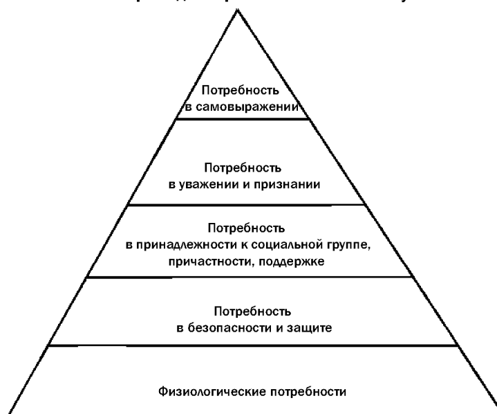
Рис. 6. Пирамида потребностей по А. Маслоу