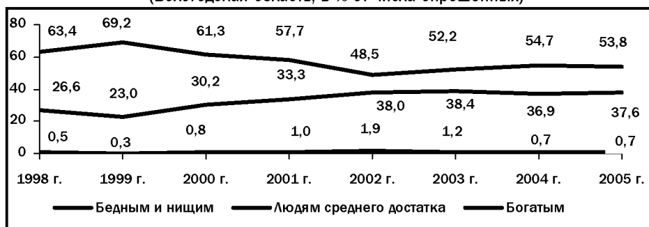
Рис. 5. Динамика социальной самоидентификации населения (Вологодская область; в % от числа опрошенных)

относящих себя к категориям «бедных» и «нищих», стремительно сокращавшаяся в 1999 – 2002 гг., в дальнейшем чуть возросла и стабилизировалась на уровне, превышающем 50%. Наиболее велика она среди пенсионеров (69% в 2005 г.), инвалидов (75%), безработных (69%), работников сфер сельского и лесного хозяйства (59%), образования (58%), культуры (59%).