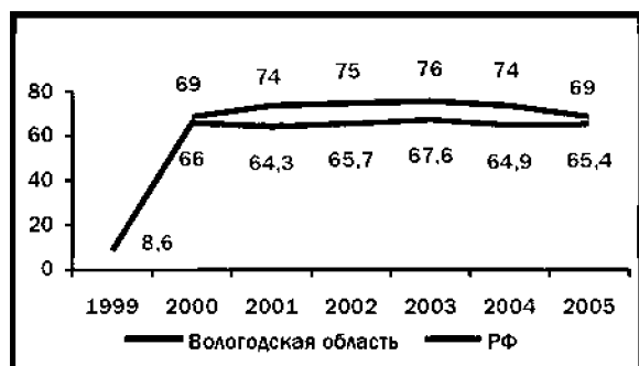
Рис. 1. Доля населения, одобряющего деятельность Президента РФ, в %