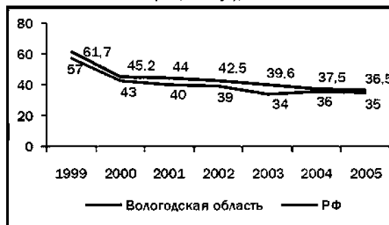
Рис. 2. Доля населения с негативной оценкой настроения («испытываю напряжение, раздражение, страх, тоску»), в %