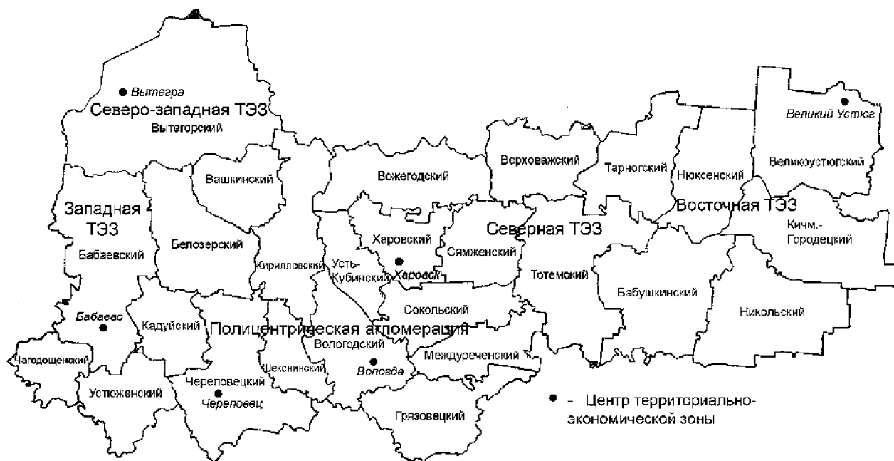
Рис. 2. Территориально-экономические зоны Вологодской области

Для оценки пространственного развития сформированных территориально-экономических зон региона необходима система показателей, которая позволила бы учесть основные факторы, влияющие на расселение, и выявить основные тенденции развития поселений. Исходя из этого предлагается система показателей, разработанная ЦСР «Северо-Запад», откорректированная с учетом особенностей региона. Оценка проводилась экспертным и расчетно-статистическим методами на основе интегрального потенциала развития (ИПР) территориально-экономических зон.