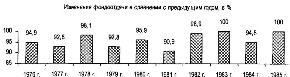
Рис. 1. Изменения фондоотдачи в промышленности Вологодской области

Почему происходило снижение? На наш взгляд, тут действовали разнородные факторы. К первой группе факторов нужно отнести причины, сформулированные в законе Харрода – Домара, согласно которому «темпы экономического роста прямо пропорциональны объему инвестиций и обратно пропорциональны капиталоемкости продукции». Другую группу составляли организационные факторы: несвоевременное освоение вводимых (проектных) мощностей, рост объемов незавершенного строительства промышленных объектов. Но самое главное – недостаточно внимания уделялось внедрению достижений научно-технического прогресса.