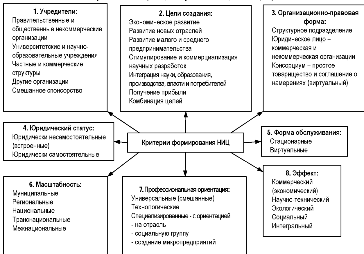
Рисунок 2. Классификация научно-инновационных центров

программ и производством новых биологически активных добавок (БАД) и препаратов. Центр расположен в самом сердце российской науки – в Новосибирском академгородке, что дает ему уникальную возможность развивать плодотворное сотрудничество с ведущими научно-исследовательскими учреждениями известного во всем мире наукограда и благодаря этому создавать самые передовые и уникальные продукты для здоровья. На сегодняшний день основными партнерами Научно-инновационного центра являются следующие академические институты и учреждения: