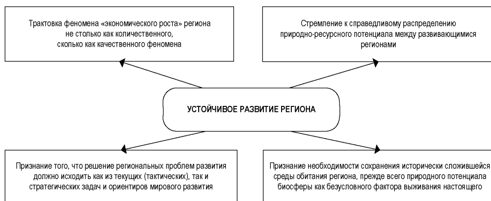
Рисунок 2. Основные подходы к понятию «устойчивое развитие региона»

Обобщенный анализ подходов к феномену устойчивого развития региональной социально-экономической системы, предложенный Л.К. Гуриевой [8, с. 48], представлен на рисунке 2.