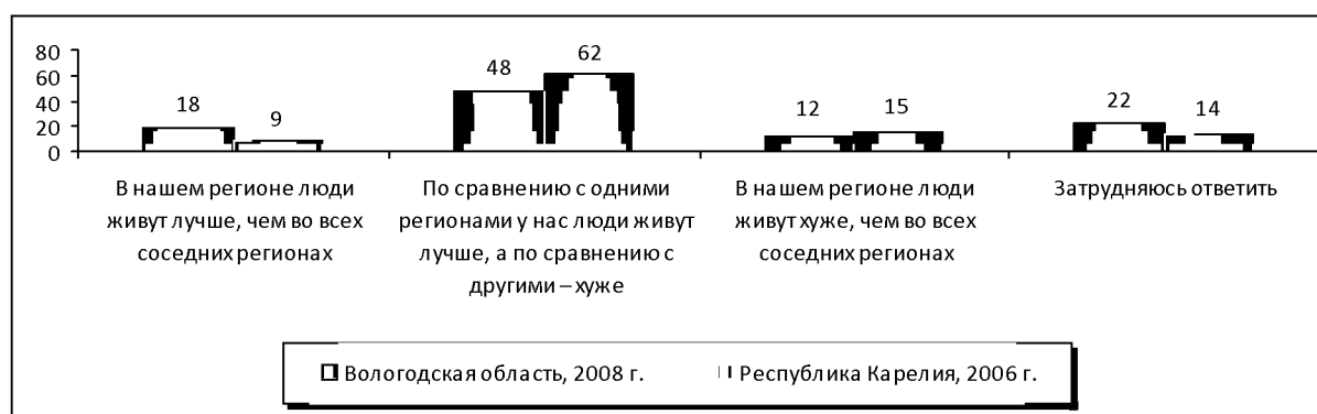
Рисунок 2. Распределение ответов на вопрос: «Как Вы считаете, жители региона живут лучше или хуже, чем жители соседних регионов?» (в Вологодской области и Республике Карелия; в % от числа опрошенных)

Мнения жителей районов и двух крупных центров Вологодской области Вологды и Череповца различаются. Так, наиболее удовлетворены жизнью в своем регионе череповчане (83%), причем 33% из них безоговорочно считают жизнь в Вологодской области лучше, чем в соседних регионах. По Вологде и районам данный показатель намного ниже