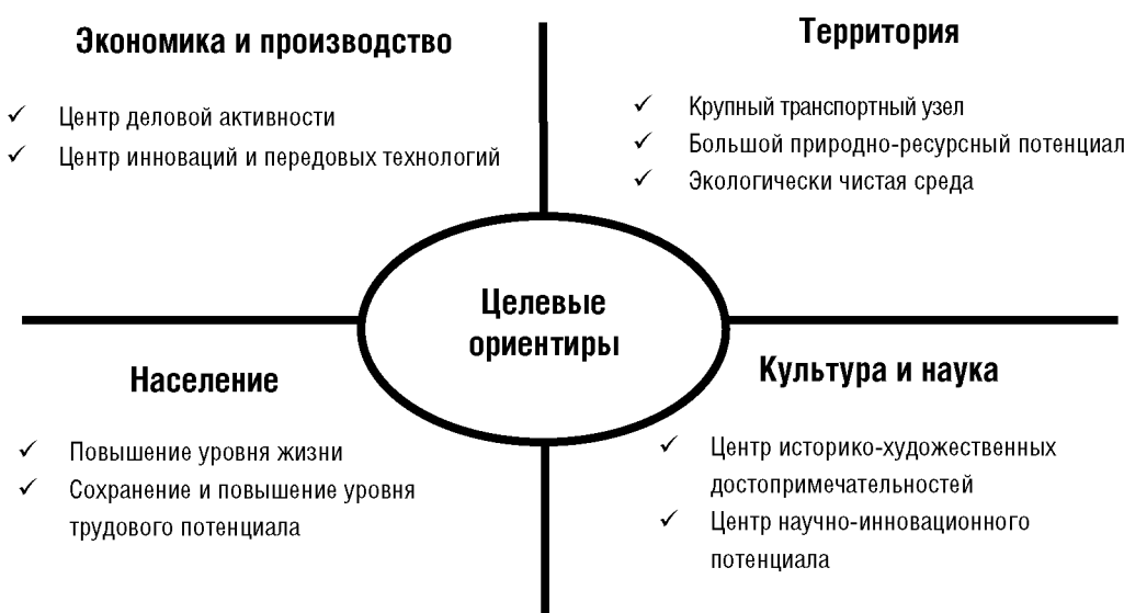
Рисунок 3. Основные целевые ориентиры развития агломерации