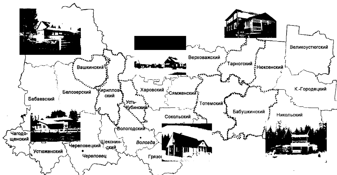
Рисунок 2. Развитие агротуризма в Вологодской области

нарию – 25% от общего числа фермерских хозяйств, второму – 5% хозяйств, третьему сценарию – 1% хозяйств (табл. 6).