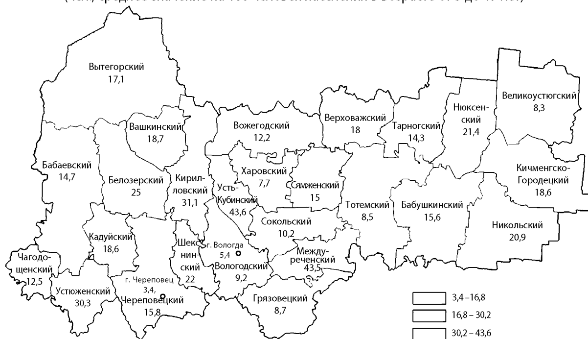
Рисунок 1. Распределение по муниципальным образованиям Вологодской области детей, находящихся в социально опасном положении, 2005 – 2006 гг. (чел.; среднее значение на 100 человек населения в возрасте от 3 до 17 лет)

Примечание. Общерегionalный показатель – 17,5 чел. на 100 чел. населения в возрасте от 3 до 17 лет.