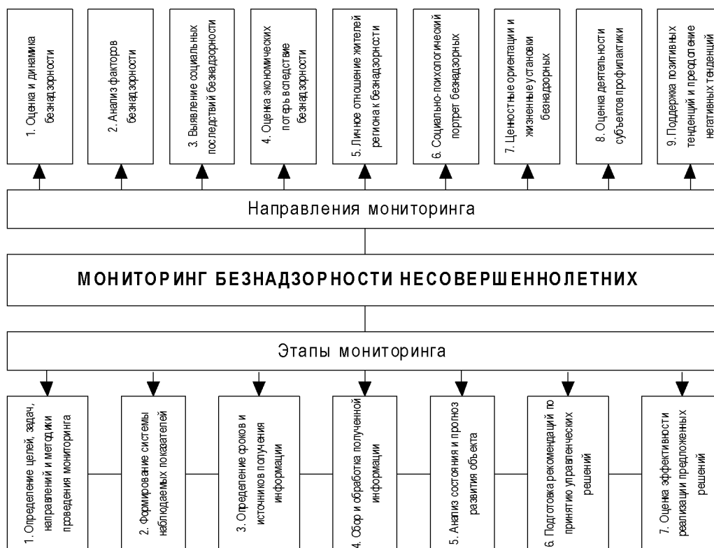
Рисунок 3. Схема организации мониторинга безнадзорности несовершеннолетних

Автором аргументируется предложение о проведении регулярного комплексного мониторинга с целью анализа и оценки современного состояния безнадзорности в детско-подростковой среде и обоснования возможностей по совершенствованию региональной социально-экономической политики в области решения проблем безнадзорности. Организация мониторинга предусматривает определение задач, принципов и основных направлений его проведения, информационной базы, исполнителей, структуры показателей (субъективные и объективные) и единиц их измерения. Схема организации и проведения мониторинга изображена на рисунке 3.