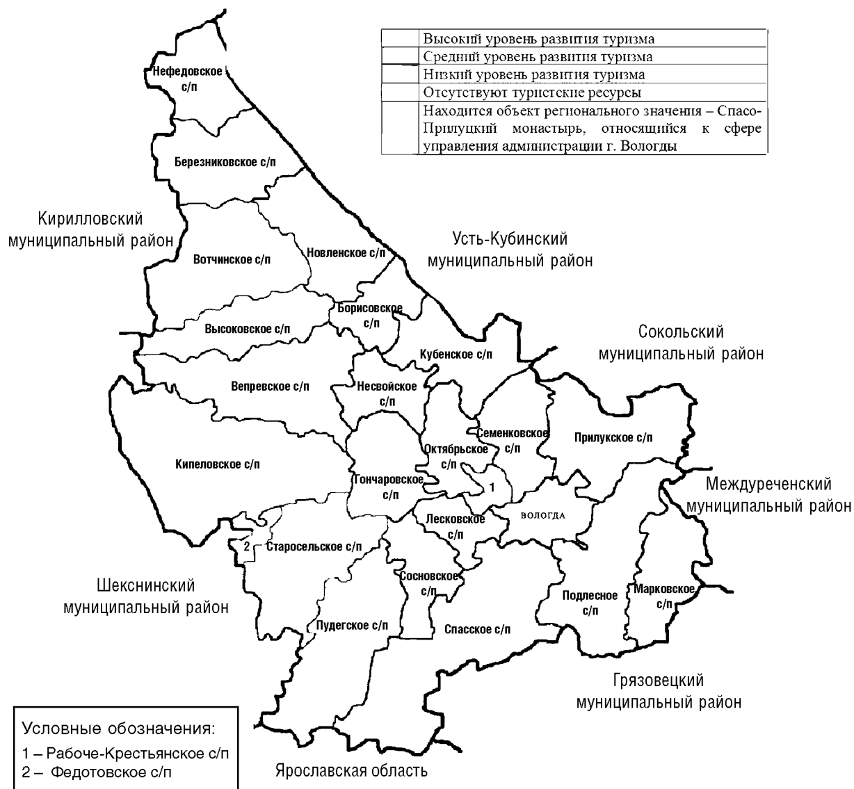
Рисунок 1. Уровни развития туризма в сельских поселениях Вологодского района

Так, туристический сектор получил наибольшее развитие в Октябрьском,