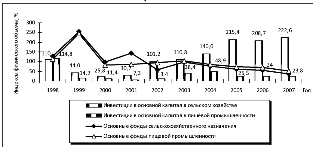
Рисунок 2. Индексы основных показателей инвестиционной деятельности АПК Республики Коми

техники и оборудования. В результате при незначительном темпе роста инвестиций в основной капитал произошло снижение физического объёма фондов в производство, что не характерно для процессов расширенного воспроизводства и активного участия предприятий в финансовых, товарных и других рынках (рис. 2).