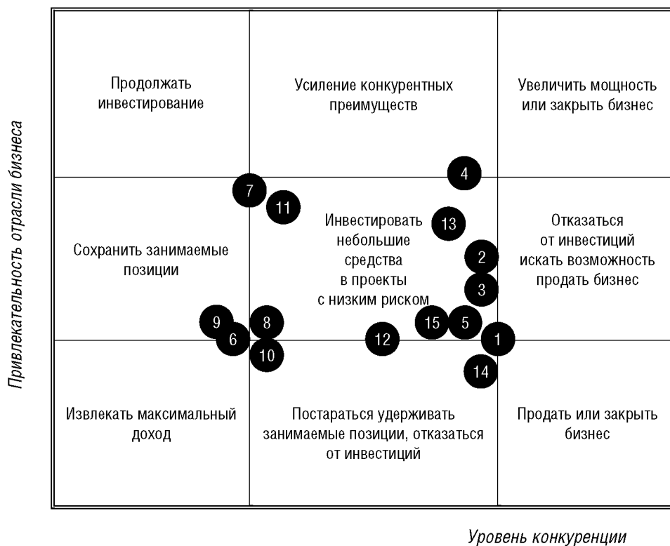
Рисунок 2. Отраслевая карта развития малого бизнеса в городе Соколе

1 – оптовая торговля промышленными товарами; 2 – оптовая торговля продовольственными товарами; 3 – розничная торговля промышленными товарами; 4 – розничная торговля продовольственными товарами; 5 – ремонт автотранспортных средств; 6 – ремонт бытовых изделий; 7 – производство продовольственных товаров; 8 – издательская и полиграфическая деятельность; 9 – производство машин и оборудования; 10 – производство металла, проката и металлических изделий; 11 – деревообработка; 12 – текстильное и швейное производство; 13 – строительство; 14 – операции с недвижимостью; 15 – транспорт.