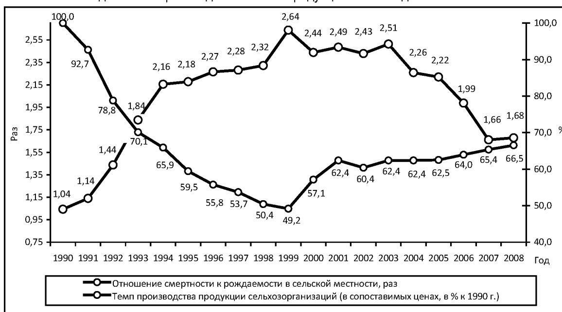
Рисунок 2. Превышение смертности над рождаемостью в сельской местности и динамика производства сельхозпродукции в Вологодской области

В сельской местности имеет место сверхвысокая смертность населения. Если в 1990 г. её уровень превышал уровень рождаемости в 1,04 раза, то в период с 1994 по 2005 г. число умерших было в 2–2,6 раза