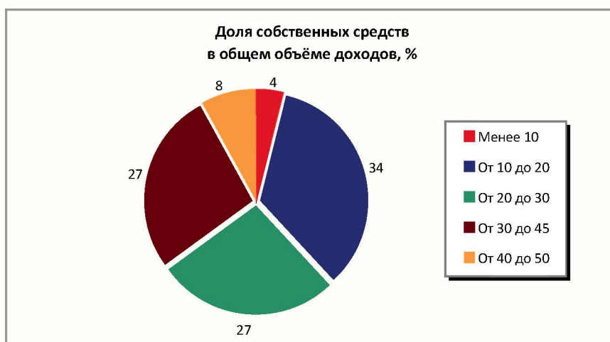
Рисунок 1. Распределение муниципальных районов Вологодской области в зависимости от доли собственных средств в общем объеме доходов в 2008 г., %