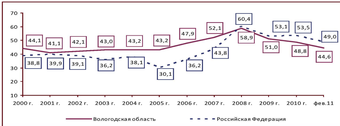
Рисунок 4. Одобрение деятельности Правительства РФ (в % от числа опрошенных)

В начале 2011 г. снизилась доля населения области, одобряющего деятельность Правительства РФ. Аналогичная ситуация наблюдается и по России в целом.