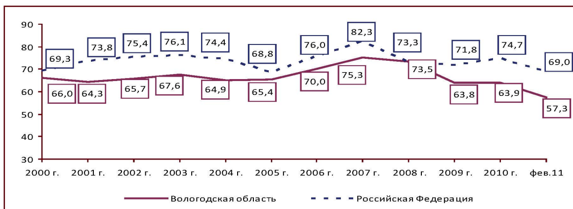
Рисунок 3. Одобрение деятельности Президента РФ (в % от числа опрошенных)

В первые месяцы 2011 г. отмечено снижение уровня одобрения деятельности Президента РФ жителями региона и России в целом.