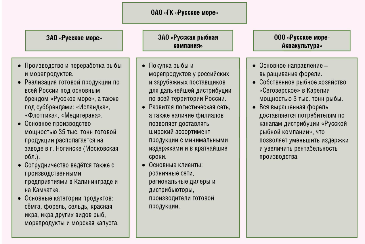
Рисунок 3. Организационная структура ОАО «ГК «Русское море»

3. Группа компаний имеет 30 офисов и филиалов на территории Российской Федерации. Продукция ОАО «ГК «Русское море» поставляется в более чем 85% регионов России [6].