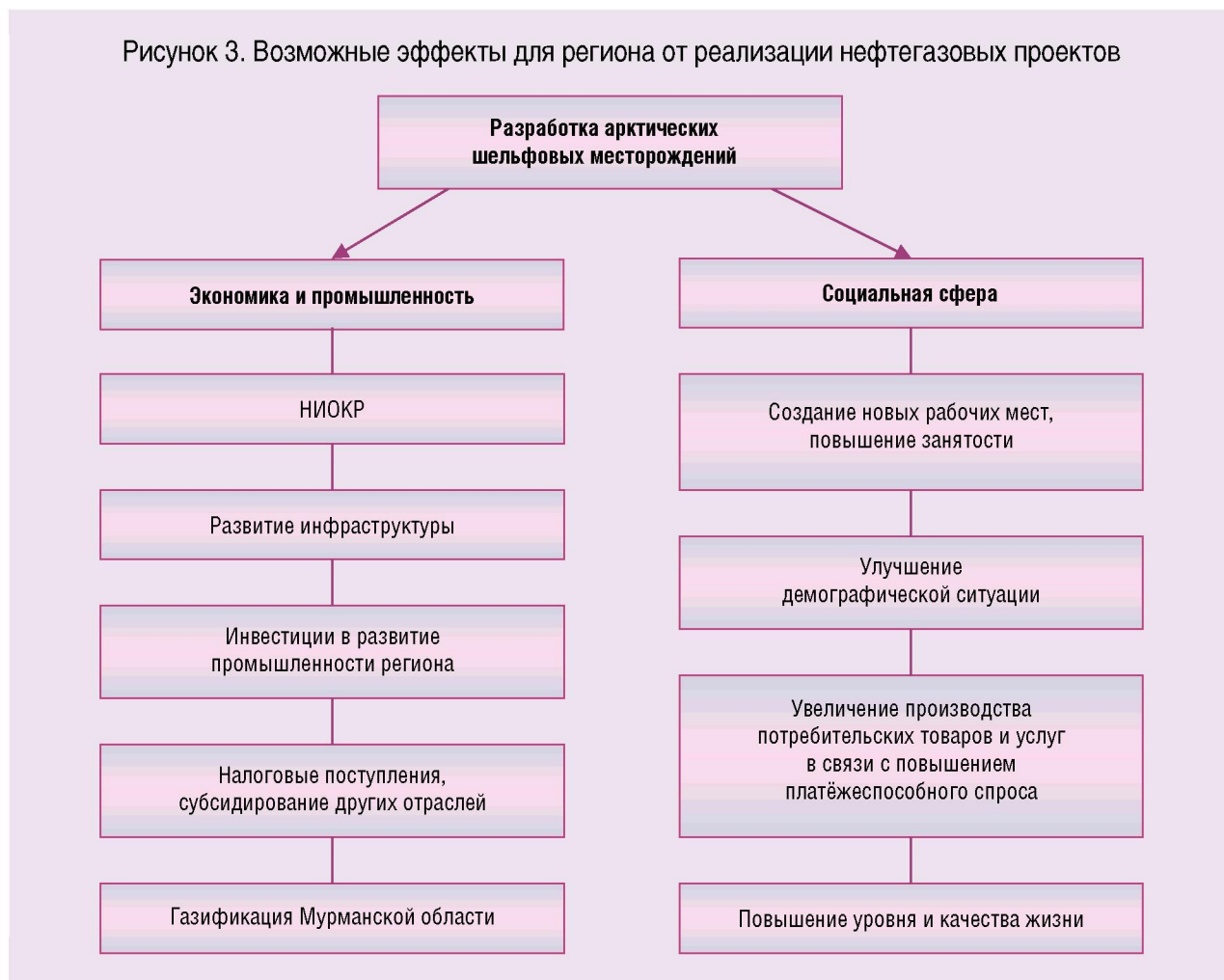
Рисунок 3. Возможные эффекты для региона от реализации нефтегазовых проектов

Примечательно, что, по некоторым данным, в проекте освоения Штокмановского газоконденсатного месторождения доходы российской стороны по «машиностроительной» линии (через размещение заказов у российских подрядчиков, перевозчиков и т.д.) могут вдвое превысить аналогичные её доходы по «газовой» линии. Максимальная загрузка мощностей и увеличение объёмов производства позволит основной массе региональных предприятий улучшить своё экономическое положение, наладить финансовое хозяйство, рассчитаться с кредиторами и наращивать собственные инвестиционные возможности.