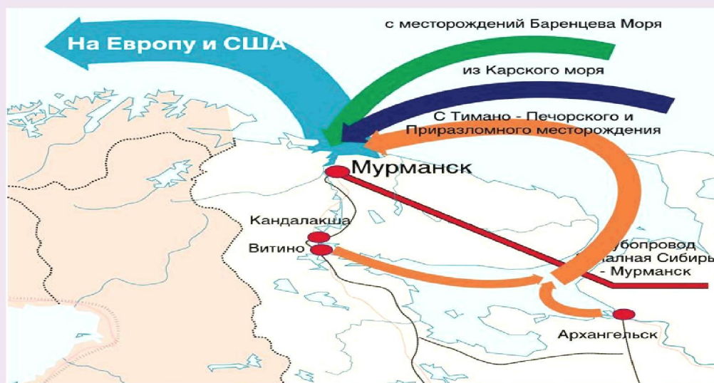
Рисунок 2. Мурманский порт как транспортный узел по доставке углеводородов к рынкам сбыта

Начало освоения шельфа арктических морей и наращивание объёмов транспортировки нефти неизбежно приведут к тому, что Мурманск станет промышленной базой реализации будущих проектов по добыче нефтегазовых ресурсов региона, и это придаст импульс развитию промышленных предприятий Северо-Запада. С большой долей уверенности можно утверждать, что сегодня Мурманск имеет такое же стратегическое значение