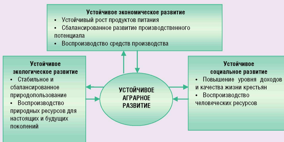
Рисунок 1. Взаимосвязь составляющих устойчивого развития сельского хозяйства

Устойчивость производства в сельском хозяйстве обусловлена спецификой отрасли и рыночных отношений в аграрном производстве – большой зависимостью от