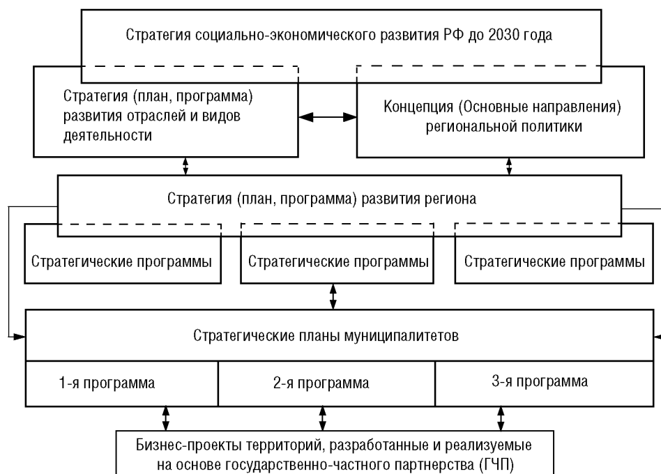
Рисунок 2. Алгоритм проектного управления территорией

достижения, инструменты реализации и ответственных за выполнение.