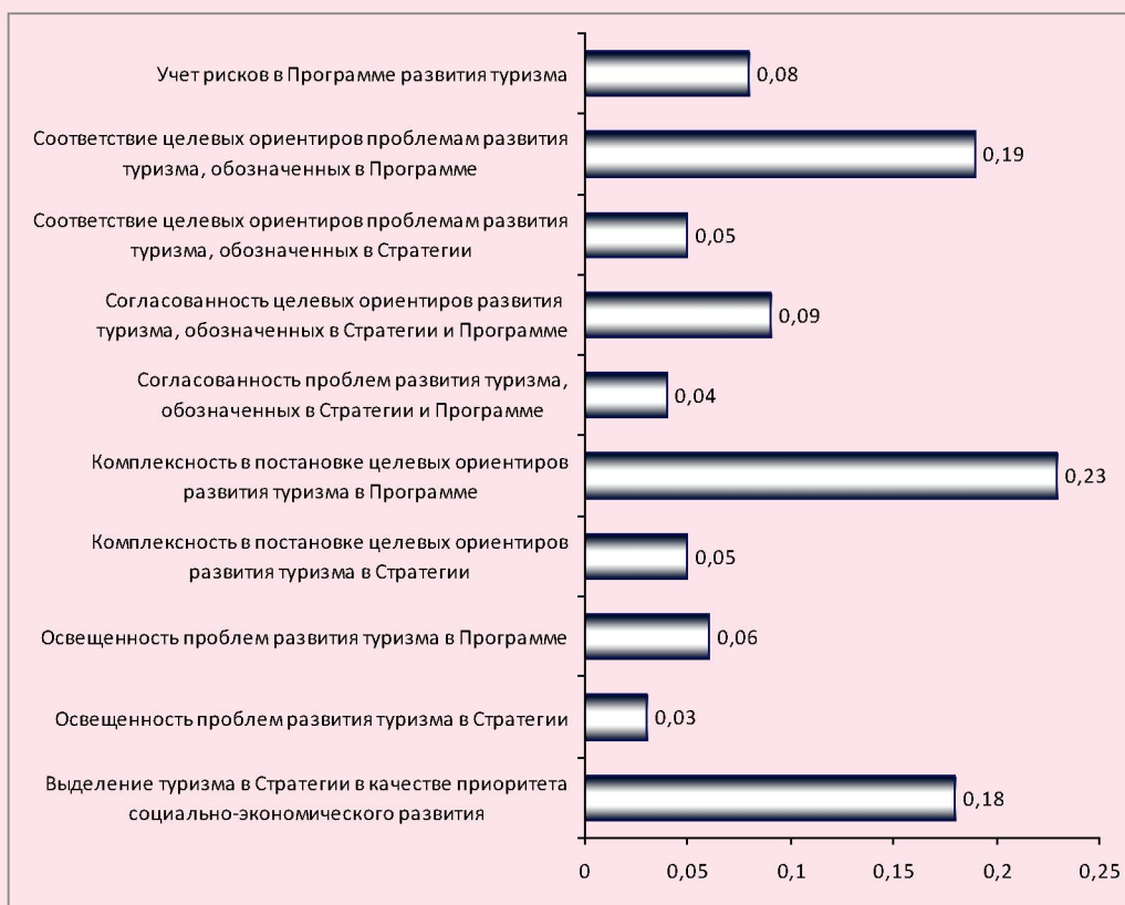
Рисунок 2. Рейтинг северных регионов России по проработанности стратегических и программных документов, регулирующих вопросы развития туризма в регионе