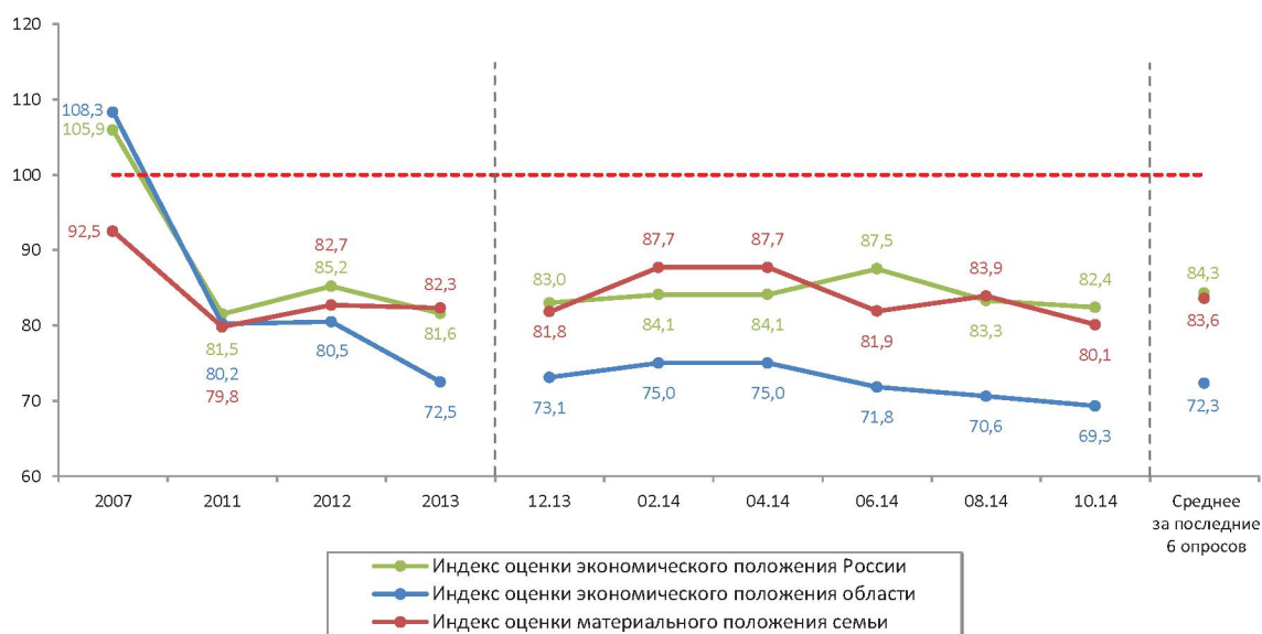
Рис. 1. Динамика индексов оценки экономического положения России и области и материального положения семьи 1