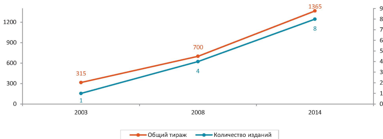
Рис. 2. Количественные показатели по направлению «Научно-издательская деятельность НОЦ»

– увеличение качественных показателей через расширение тематического наполнения, улучшение дизайна изданий, корректировка рубрикатора и др.;