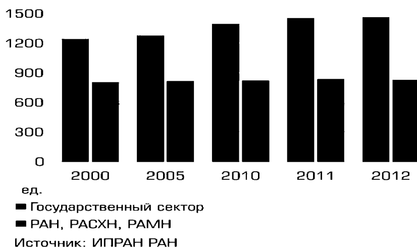
График 1 Организации, выполняющие исследования и разработки

Для успеха реформы науки предельно важно найти правильную платформу взаимодействия между ФАНО и РАН. Имеются декларации о совместных действиях, экспертных функциях РАН, согласовании кадровых решений. Но практически институты полностью отрезаны от какого-либо влияния со стороны РАН. Если кому-то кажется, что это путь к оздоровлению науки, то это большая ошибка. В сегодняшних обстоятельствах лучшим решением было бы сделать институты учреждениями двойного подчинения. Тем более что принцип «двух ключей» с самого начала был положен в основу реформы, как объявлялось ее инициаторами. В этом случае директора институтов, как отвечающие за имущественную составляющую, назначались бы ФАНО, а их научные руководители были бы номенклатурой