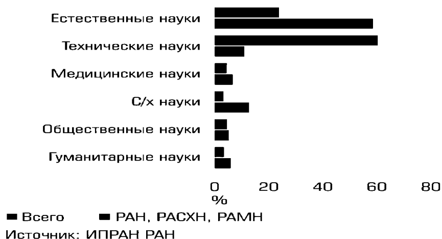
Распределение исследователей по областям науки в 2012 году График 2

Нужны ли гранты? Полезна ли эта форма поддержки науки? Да, но только как дополнение к базовому финансированию. Потому что если придать ей всеобъемлющее значение, то в специализированных институтах, таких как институты Академии наук, эта форма финансирования может стать просто разрушительной. Так же, как и в случае с ФАНО, перекос в применении