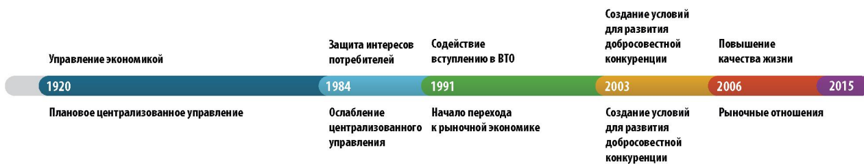
Рис. 1. Цели стандартизации в РФ (с 1920 г.)

Результатами работы данного ТК стали стандарт ISO 37120:2014 «Устойчивое развитие сообществ – индикаторы городских услуг и качества жизни», а также проекты стандартов ISO/CD 37101 «Устойчивое развитие и возможности сообществ – системы управления – общие принципы и требования» и ISO/AWI TR 37121 «Пересмотр существующих индикаторов устойчивого развития и возможностей сообществ».