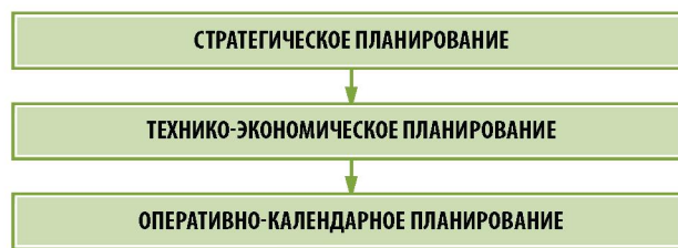
Рис. 3. Подсистемы планирования предприятия