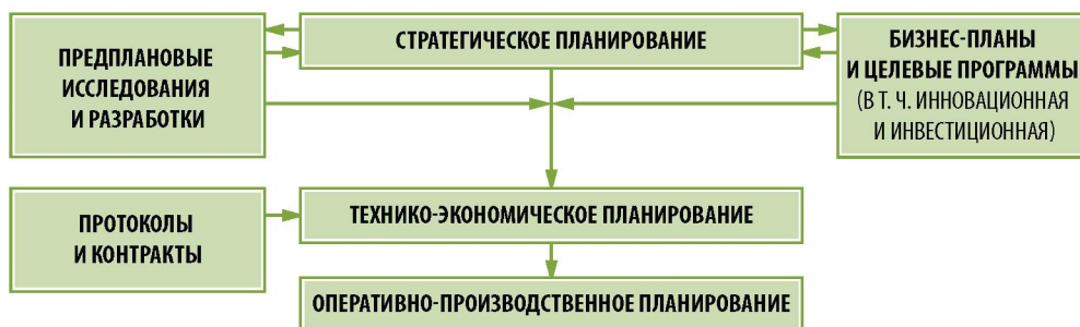
Рис. 4. Система планирования предприятия