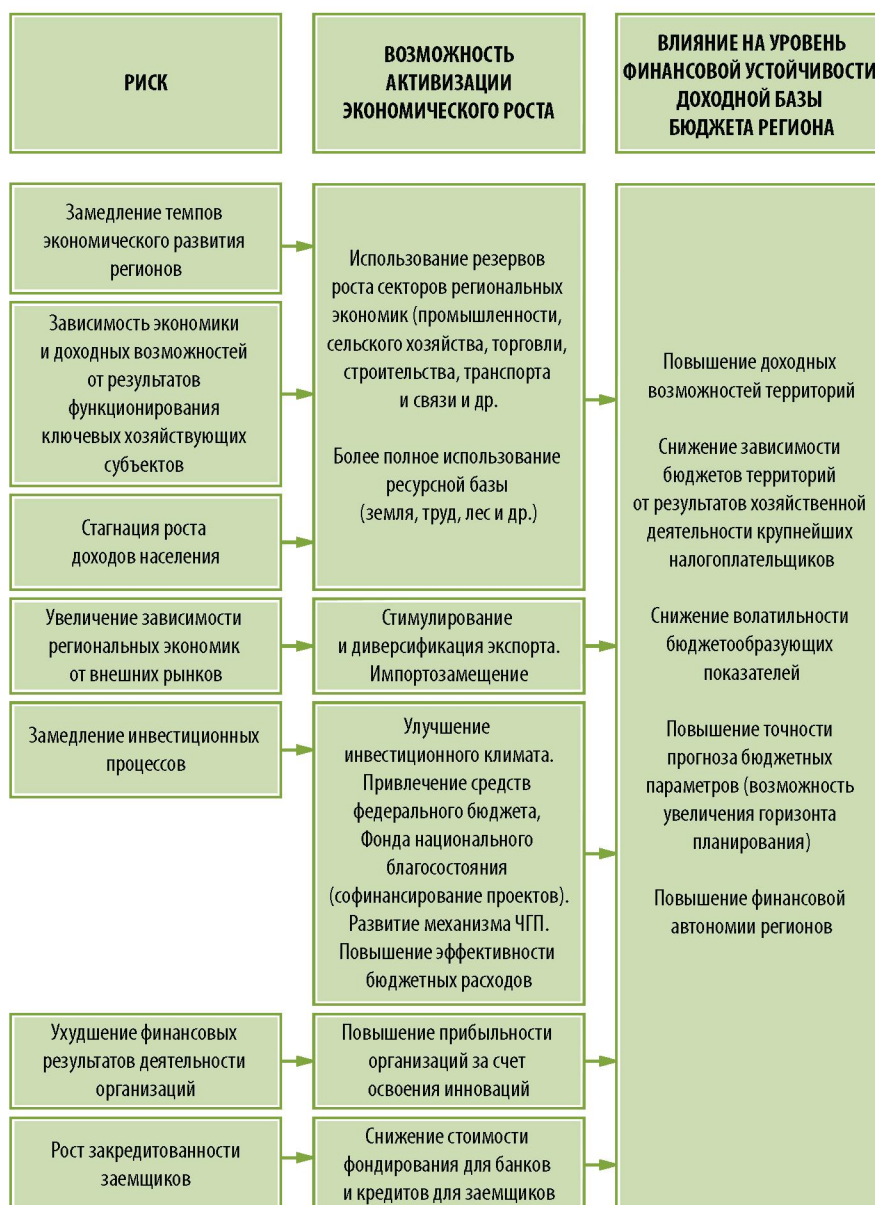
Рис. 3. Риски развития доходного потенциала регионов СЗФО, возможности экономического роста, влияние его реализации на уровень финансовой устойчивости доходной базы бюджетов регионов

Текущее положение в России, характеризующееся как кризисное, во многом имеет фундаментальные причины, связанные с низким уровнем конкурентоспособности российской экономики. Однако, по справедливому замечанию Майкла Портера, в деле изменения фундаментальных параметров, определяющих конкурентоспособность экономики, важную роль