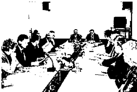
Заседание семинара в администрации Грязовецкого района