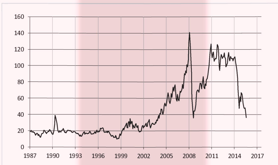
Рисунок 3. Цены на нефть марки Brent за последние 28 лет