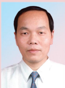
Сунь Юйпин Академия общественных наук провинции Цзянси Китай

Аннотация. Трудовые ресурсы — необходимый производственный фактор регионального экономического развития и один из важнейших показателей оценки конкурентоспособности региональной экономики. Великие экономические успехи Китая, достигнутые благодаря 30-летней политике реформ и открытости, внесли ощутимый вклад в его развитие: Китай смог использовать преимущество «демографического дивиденда», ускорить процессы индустриализации и урбанизации и стать вторым по величине экономическим субъектом в мире. «Демографический дивиденд» включает в себя трудящихся-мигрантов. К их миграции приводит смена занятости, имеющая типичные региональные черты, и несбалансированность региональной экономики. В целях достижения гармоничного развития слаборазвитые районы должны определить характер и механизмы регулирования данного явления, разработать программу промышленного развития и оказания помощи трудящимся-мигрантам, а также регулировать их поток и помогать им приспособиться к городской жизни. Это позволит улучшить региональную экономическую конкурентоспособность.