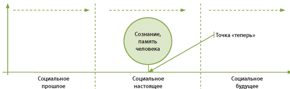
Рис. Концептуальная модель социальной перспективы