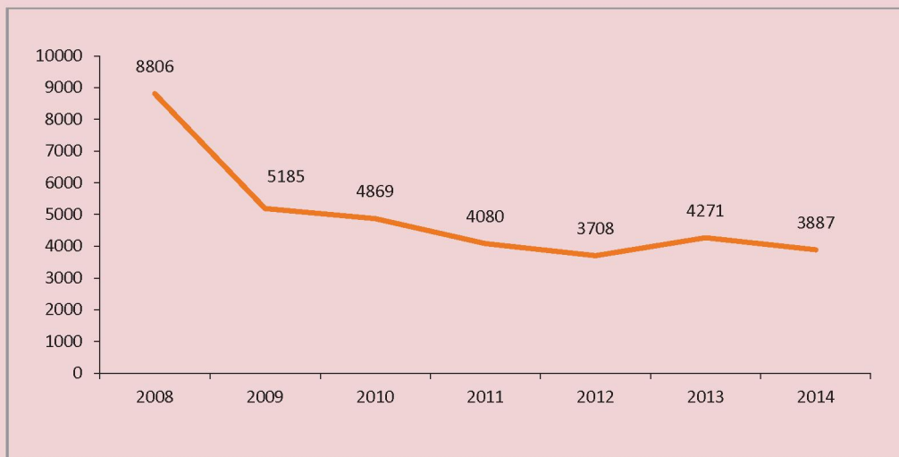
Рисунок 2. Численность инвалидов, трудоустроенных на квотируемые рабочие места, чел.