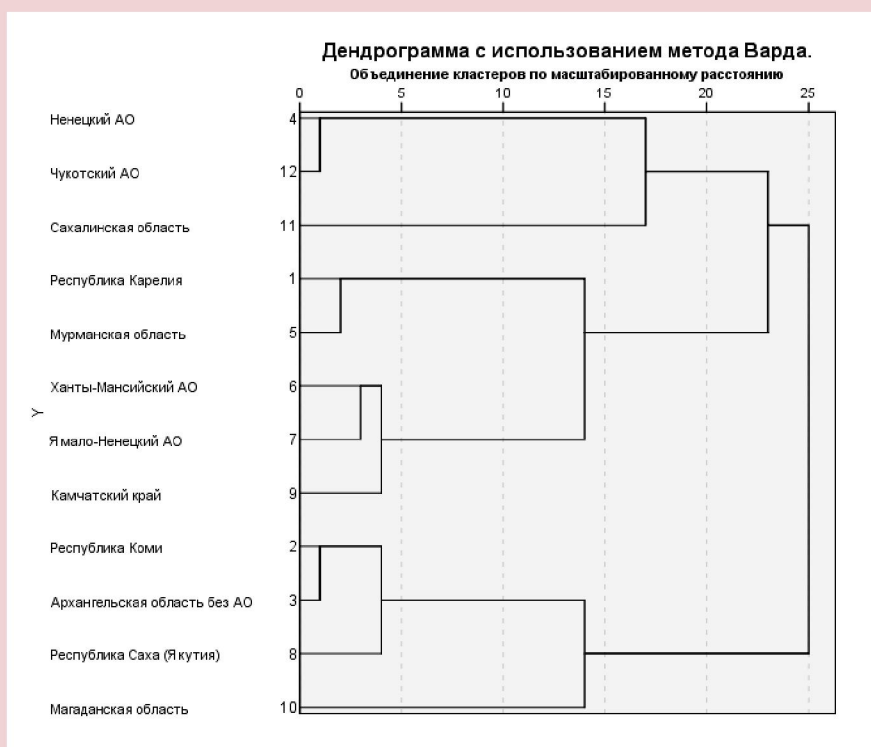
Рисунок 2. Дендрограмма многомерной классификации северных регионов России по показателям инновационного потенциала в 2014 г.*

Кластер 1 — сюда попал лишь один регион — Сахалинская область. Главное его отличие от всех остальных состоит в очень большом объеме затрат на технологические инновации — почти 150 тыс. руб. на одного занятого в экономике. Столь же уверенное первенство принадлежит области и по объёму инновационной продукции — более