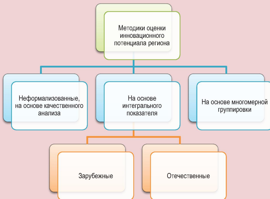
Рисунок 1. Методики оценки инновационного потенциала региона*

Вторая группа методов, наиболее популярная и развитая на сегодняшний день, заключается в расчёте интегральных показателей как по отдельным составляющим инновационного потенциала, так и по всей совокупности его характеристик. За рубежом подобные исследования проводятся более 30 лет, в России они получили широкое распространение в последнее десятилетие [1]. Из наиболее известных зарубежных методик такого типа можно назвать методику Всемирного экономического форума для оценки конкурентоспособности 2 ; мониторинг Комиссии европейских сообществ, включающий в себя более десяти различных инструментов 3 ; методику Организации экономического